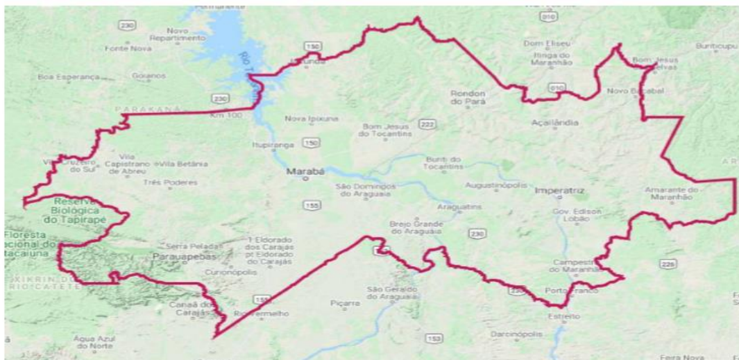
Figura 1: Localização e delimitação do Território do PAT Meio Norte.