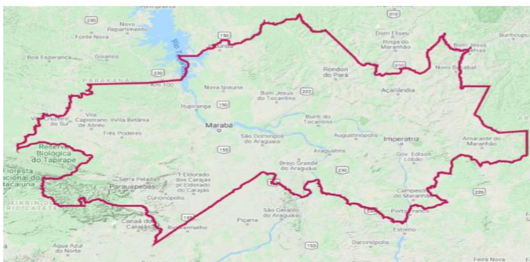
Figura 1: Localização e delimitação do Território do PAT Meio Norte.

O escopo de trabalho para os serviços especificados nesta Carta Convite são territórios do PAT Meio Norte (Figura 1), que abrange os estados do Maranhão, Tocantins e Pará, cobrindo uma área de aproximadamente 79.363 km 2 e o PAT Xingu (Figura 2), que abrange os núcleos Volta Grande do Xingu e São Félix do Xingu, inseridos na região da Bacia do rio Xingu, que é considerada única no planeta por sua diversidade e dimensão.